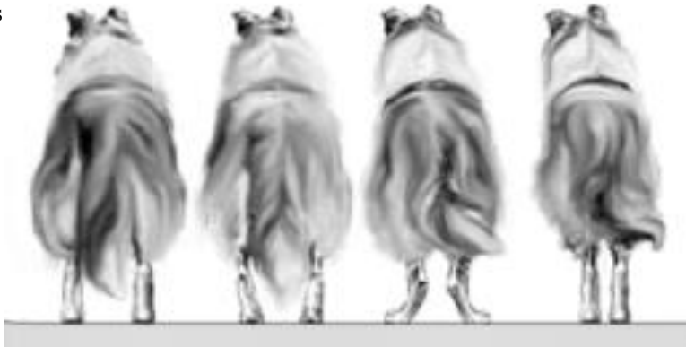
CORRETO VARO VALGO ESTREITO

ANTERIORES: ombros inclinados e bem angulados. Membros com boa ossatura, retos e musculosos, com cotovelos não virando nem para dentro nem para fora, com ossos